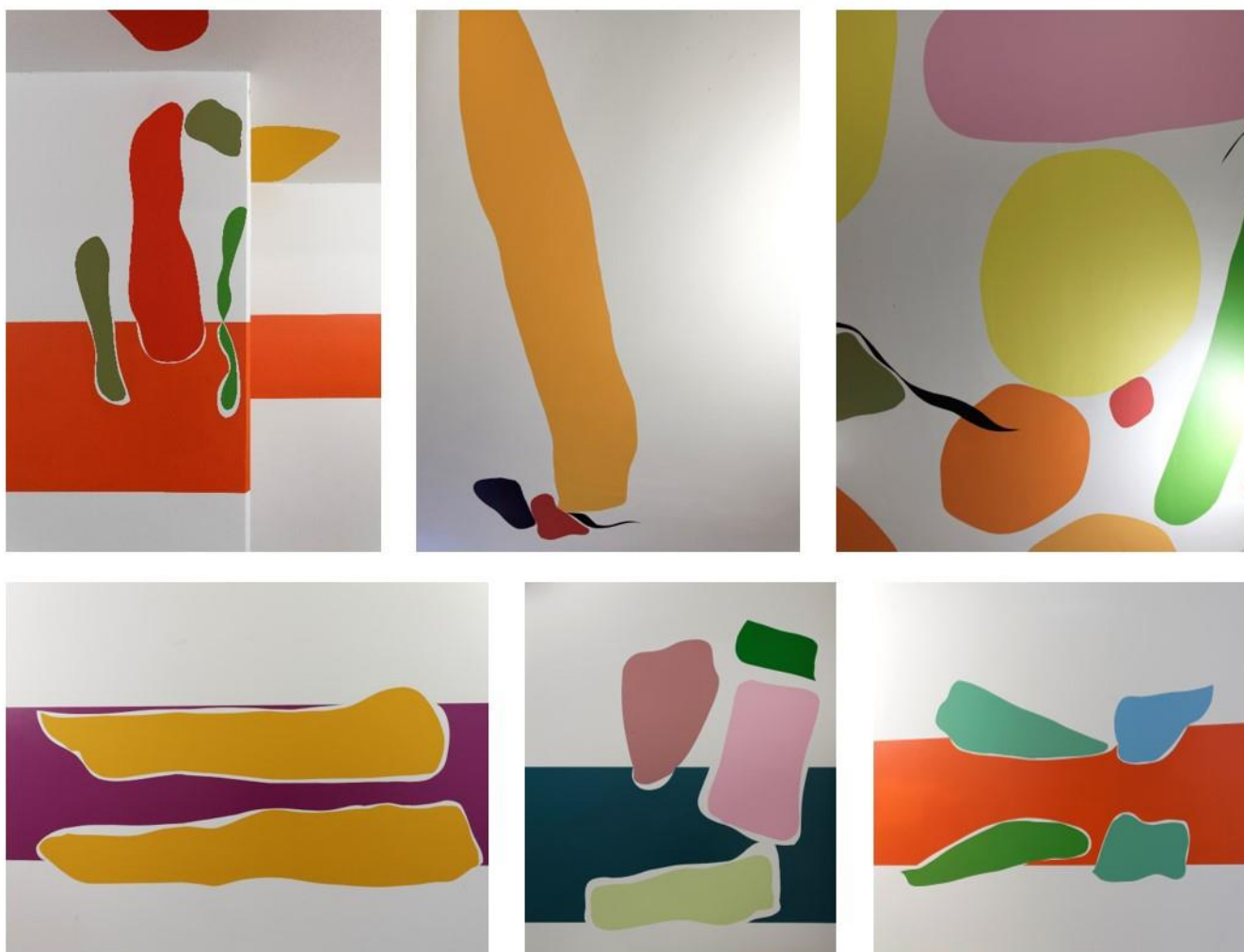
"Les bosquets" par Stéphane Calais

Mi-février, Marignan inaugurerait le grand projet multifonctionnel Paris-Batignolles, et par la même occasion, l'œuvre "Les bosquets", réalisée par Stéphane Calais, et la galerie Folle Béton.