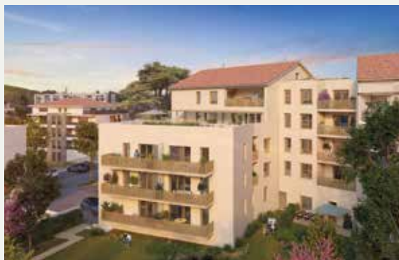
MILLÉSIME À FONTAINES-SUR-SAÔNE (69)