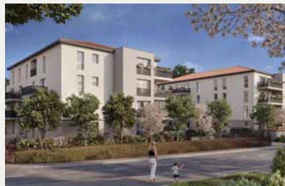
LE CLOS DES AMANDIERS À JASSANS-RIOTTIER (69)