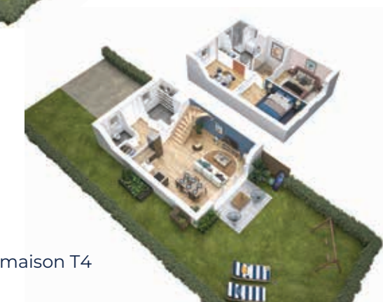
Exemple de maison T4