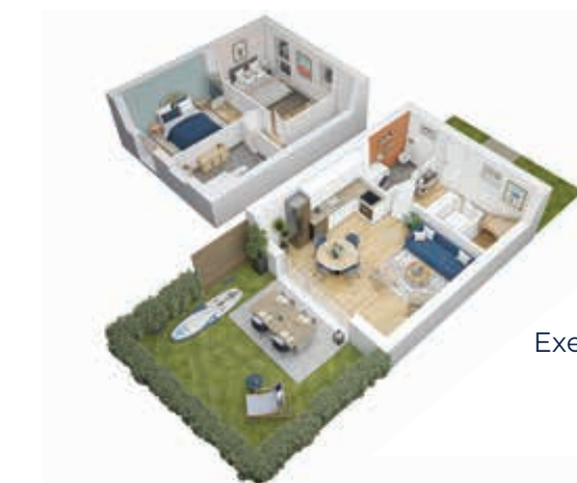
Exemple de maison T3