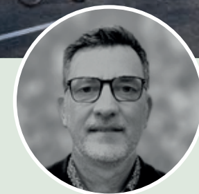
Luc Beckers CLN Architecture

Pour le bien-être de ses résidents, Urbanéo Les Mines accueille des espaces verts totalisant 1 600 m 2 . Ils sont agrémentés d'arbres conservés, dont certains oliviers, complétés par plusieurs arbres nouvellement plantés, sélectionnés parmi des essences locales telles que le micocoulier de Provence, l'Érable de Montpellier, l'Arbre de Judée et le chêne vert.