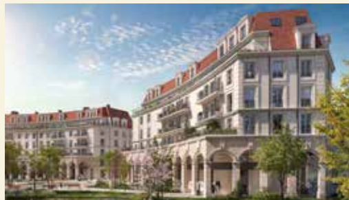
LE PARC DES BERGÈRES À PUTEAUX (92)

NOS EXEMPLES DE RÉALISATIONS DANS LA RÉGION