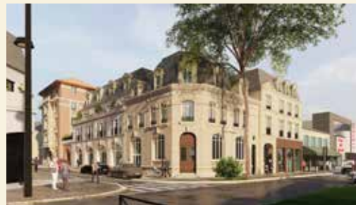
EMBLÈME À RUEIL-MALMAISON (92)