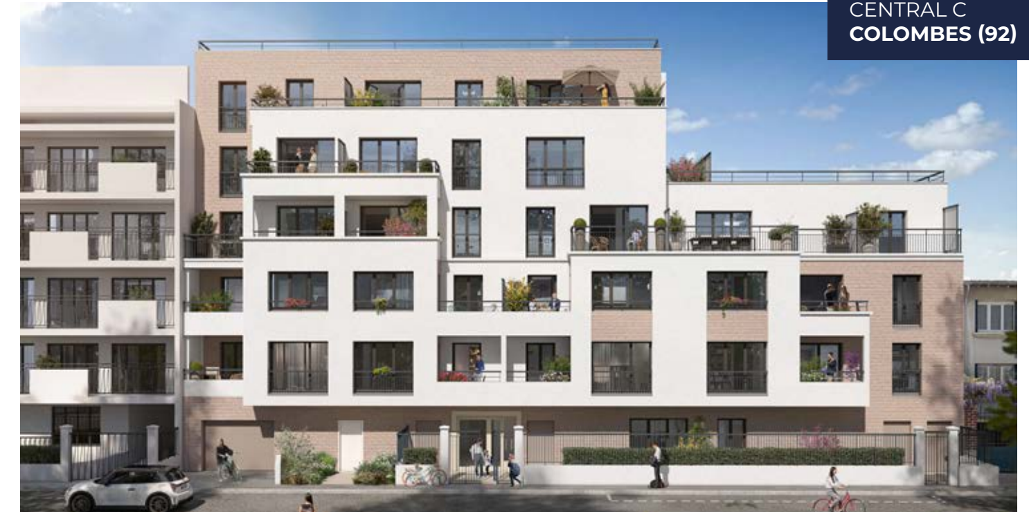
CENTRAL C COLOMBES (92)