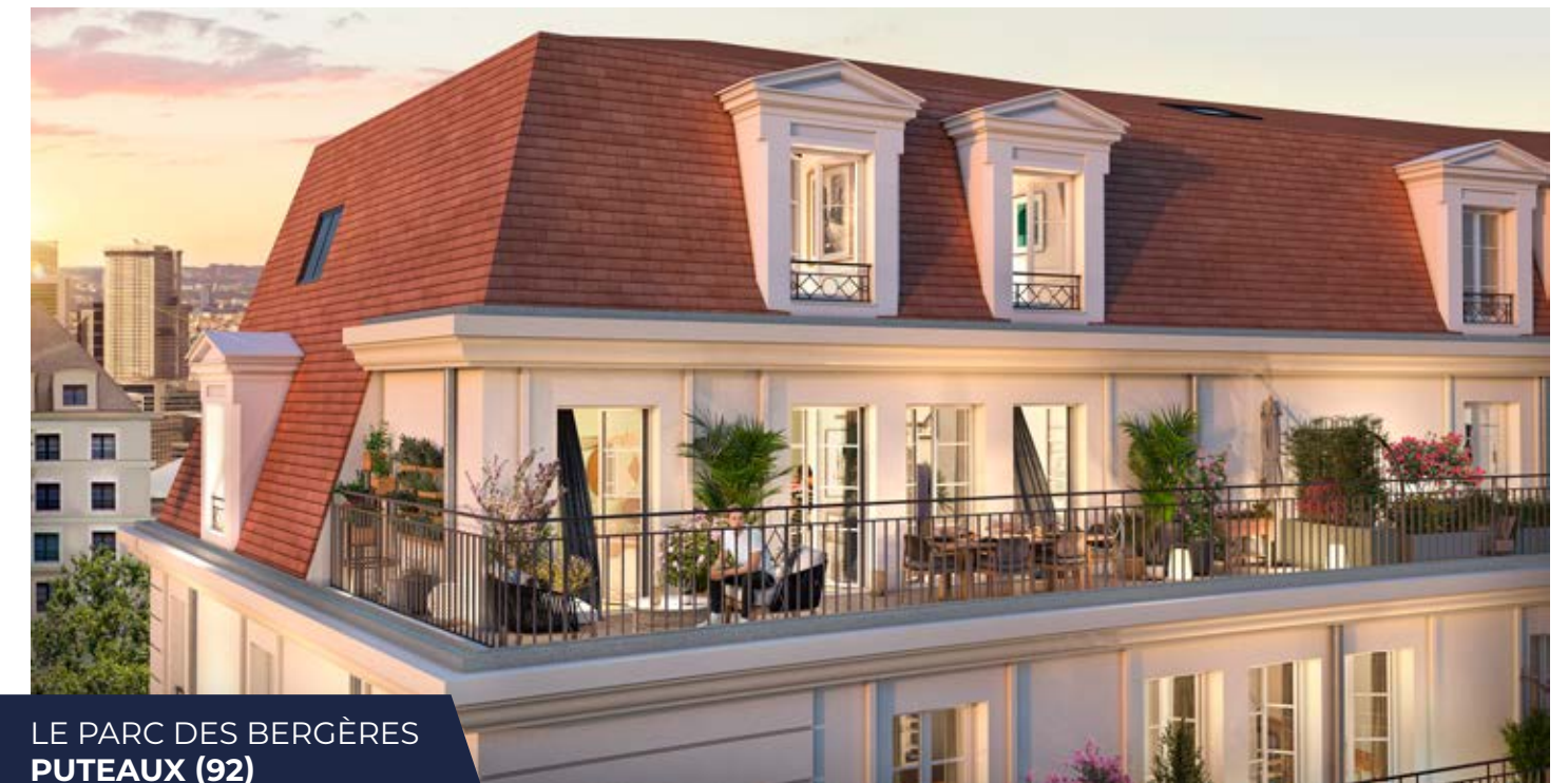
LE PARC DES BERGÈRES PUTEAUX (92)