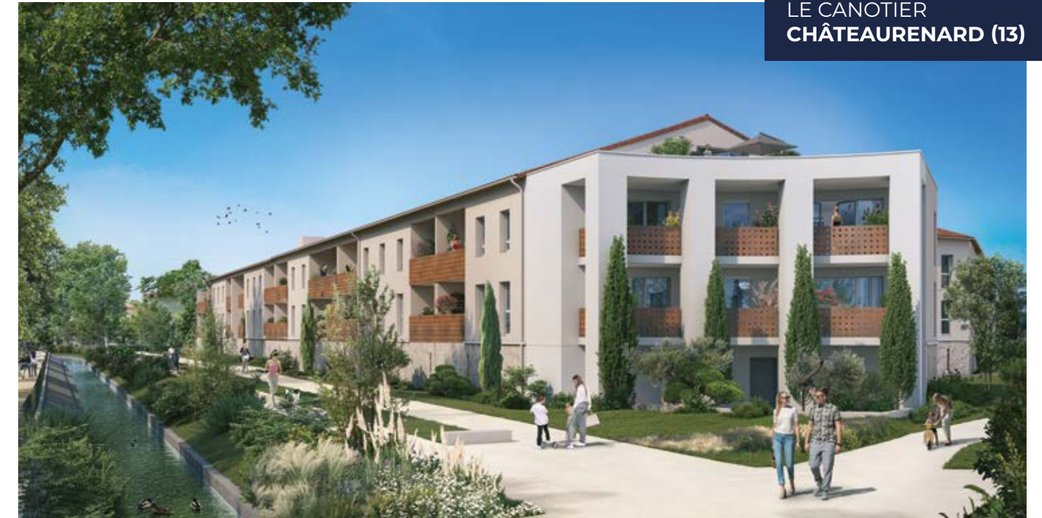
NOS EXEMPLES DE RÉALISATIONS DANS LA RÉGION