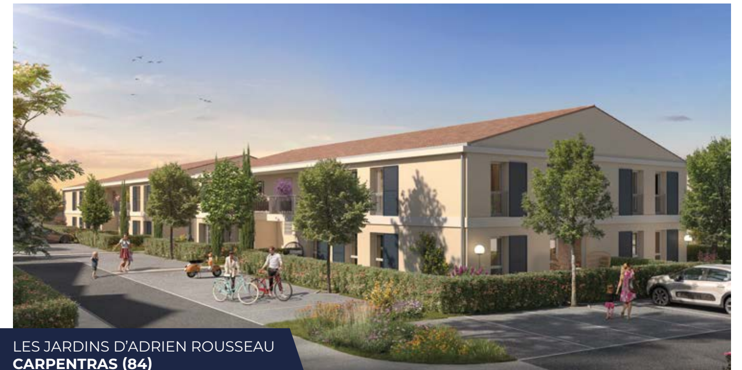
LES JARDINS D'ADRIEN ROUSSEAU CARPENTRAS (84)