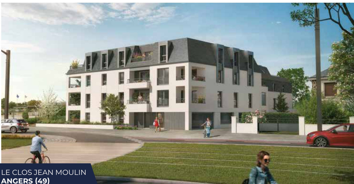
LE CLOS JEAN MOULIN ANGERS (49)