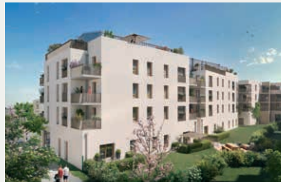
LE CALICE À BRIGNAIS (69)