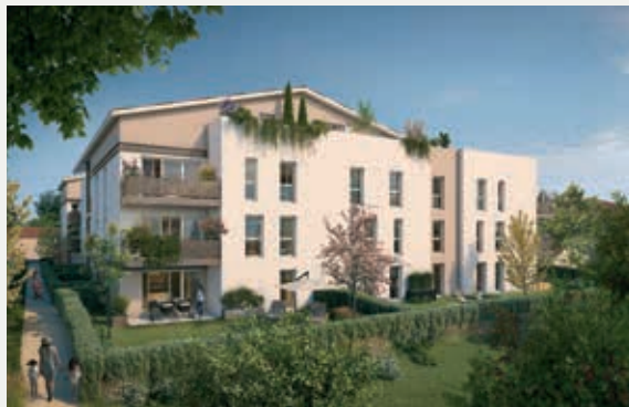
SECRET GARDEN À SIMANDRES (69)