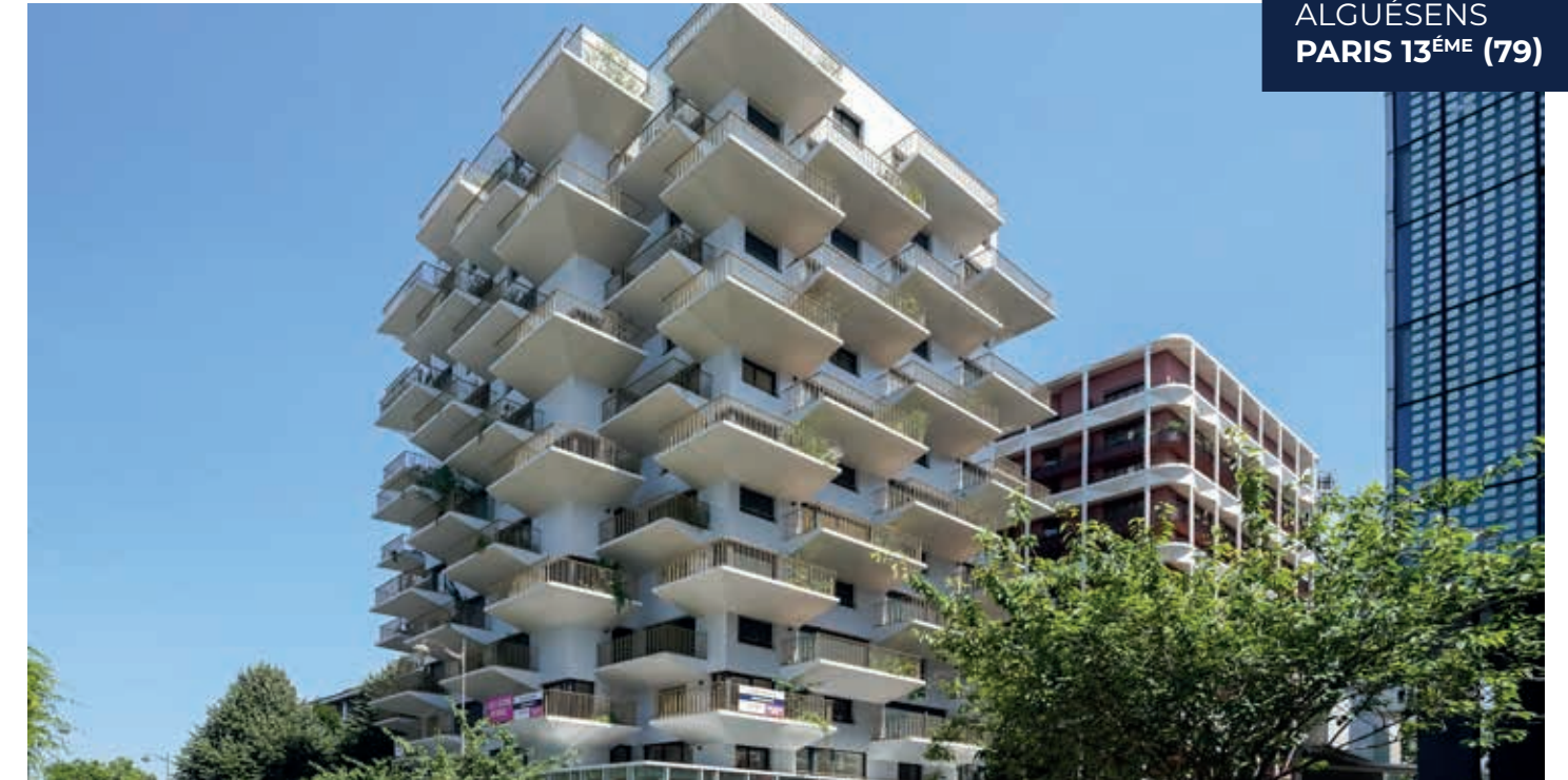
ALGUÉSENS PARIS 13 ÈME (79)