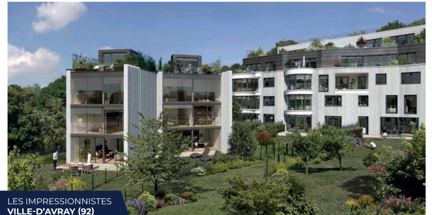
LES IMPRESSIONNISTES VILLE-D'AVRAY (92)