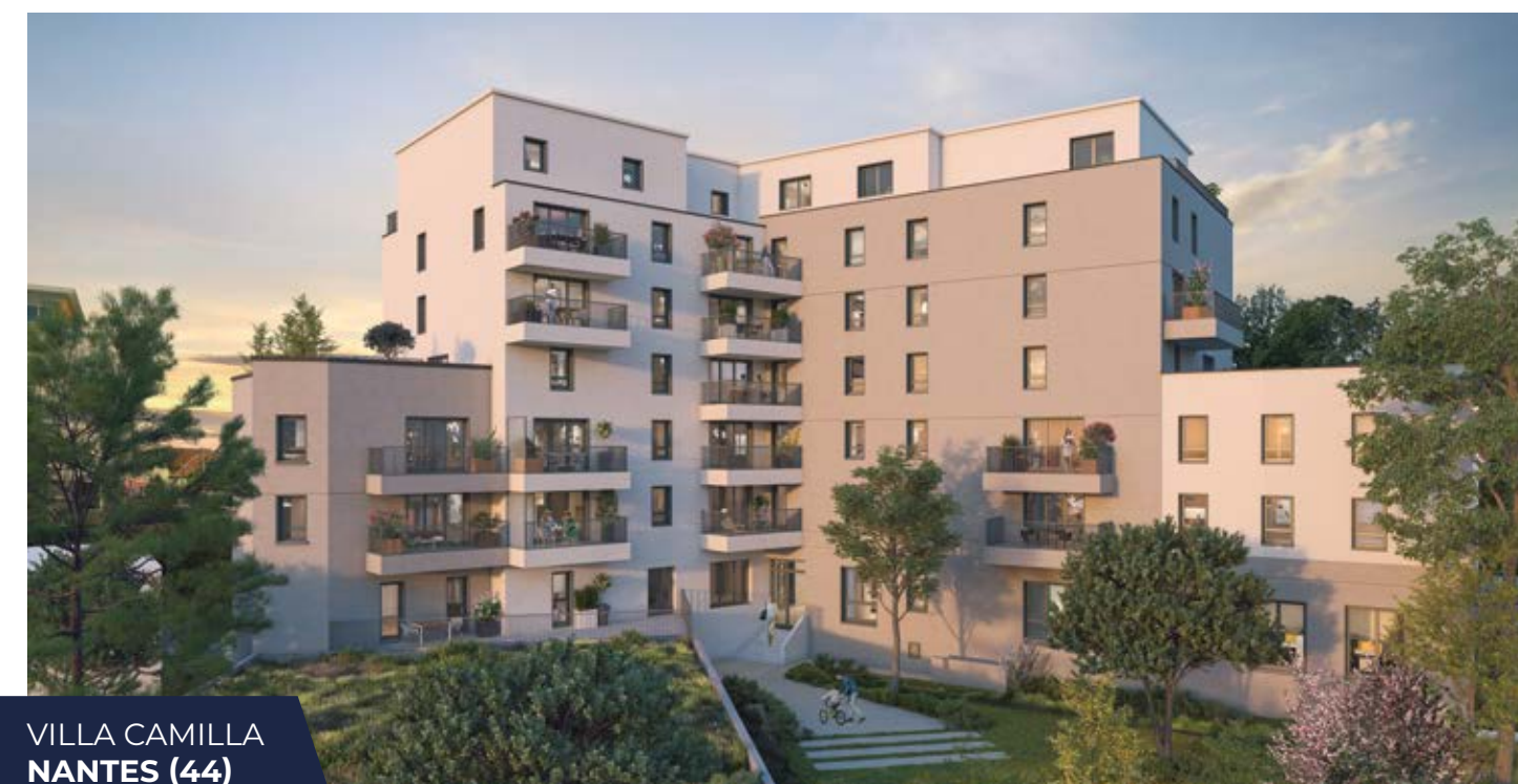
VILLA CAMILLA NANTES (44)