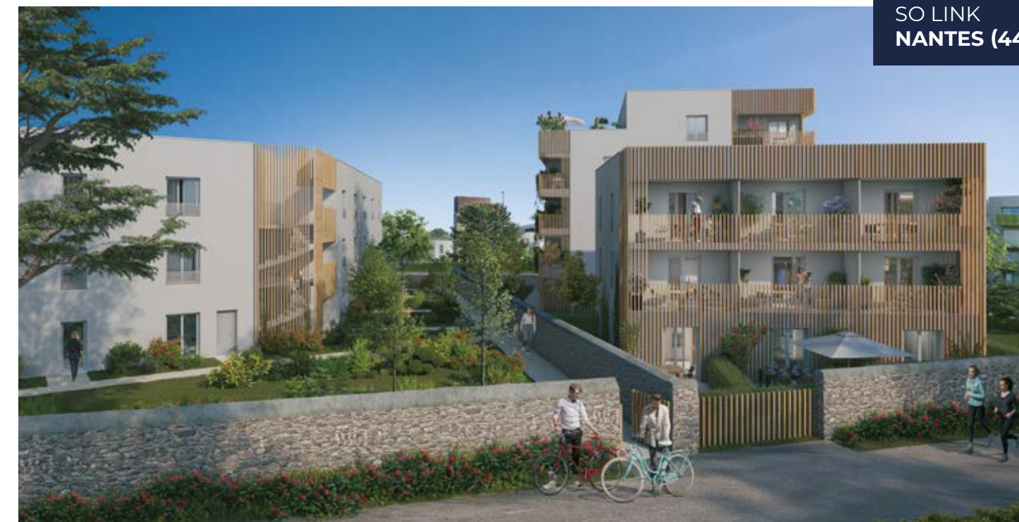
SO LINK NANTES (44)