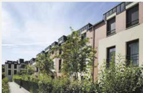
ETERN'L À ANTONY (92)