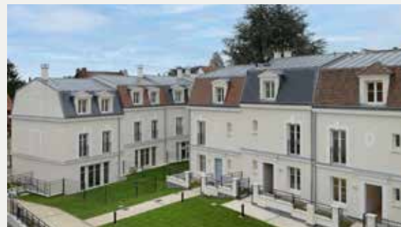
LE DOMAINE À CHATENAY-MALABRY (92)