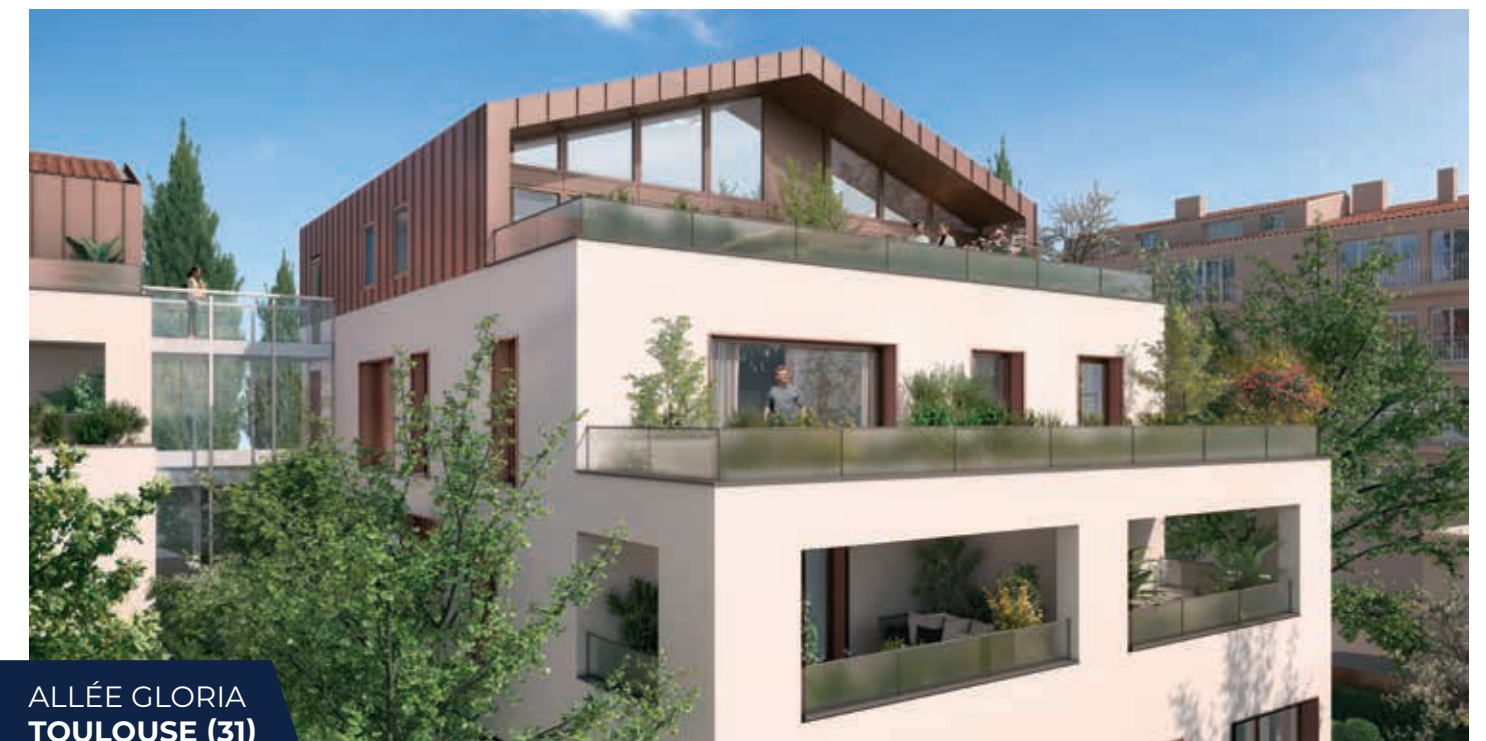
ALLÉE GLORIA TOULOUSE (31)