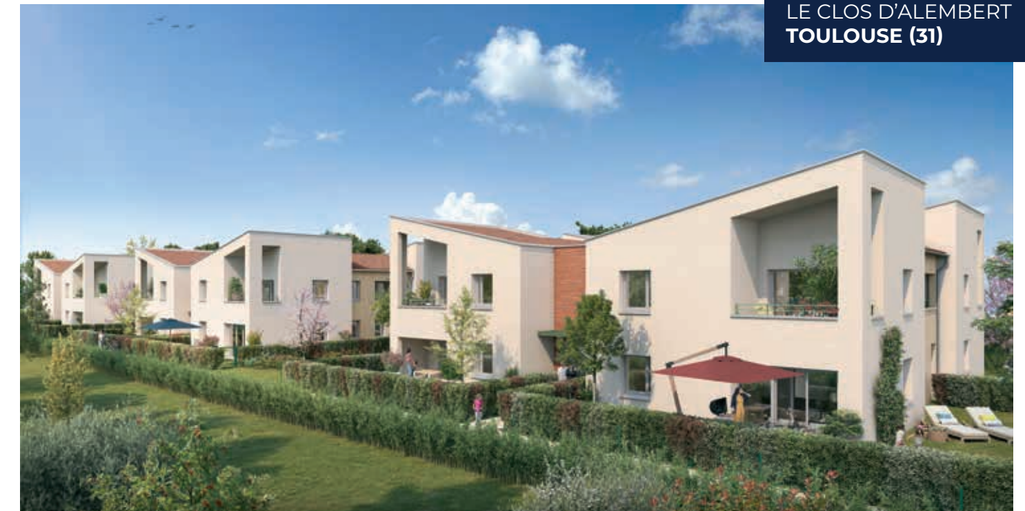
LE CLOS D'ALEMBERT TOULOUSE (31)