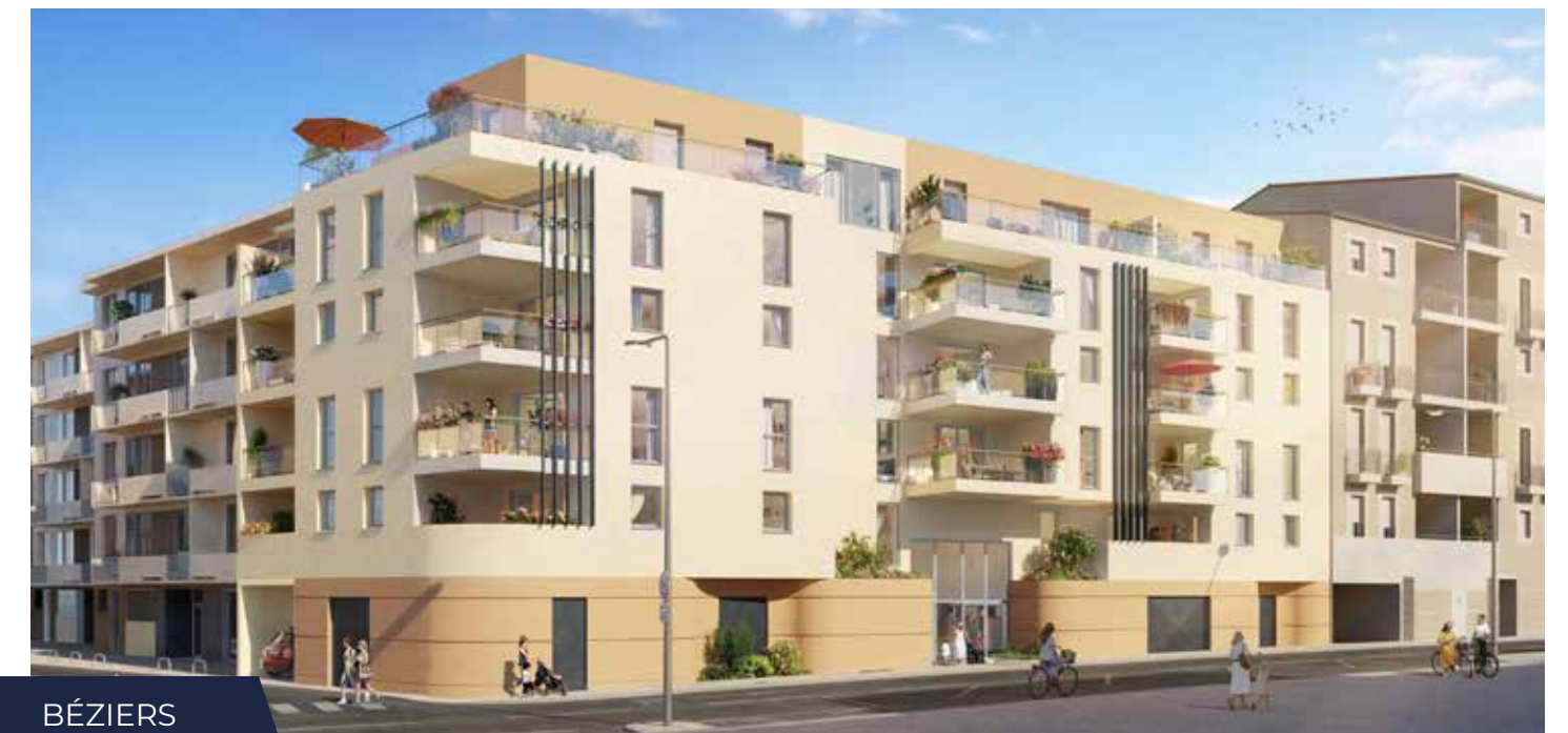
BÉZIERS OVÉA (34)