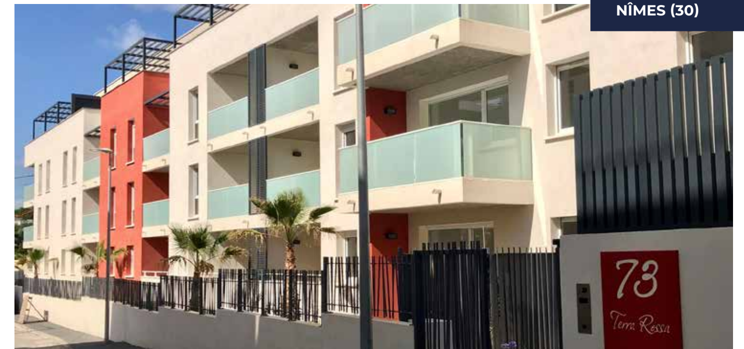
TERRA ROSSA NÎMES (30)