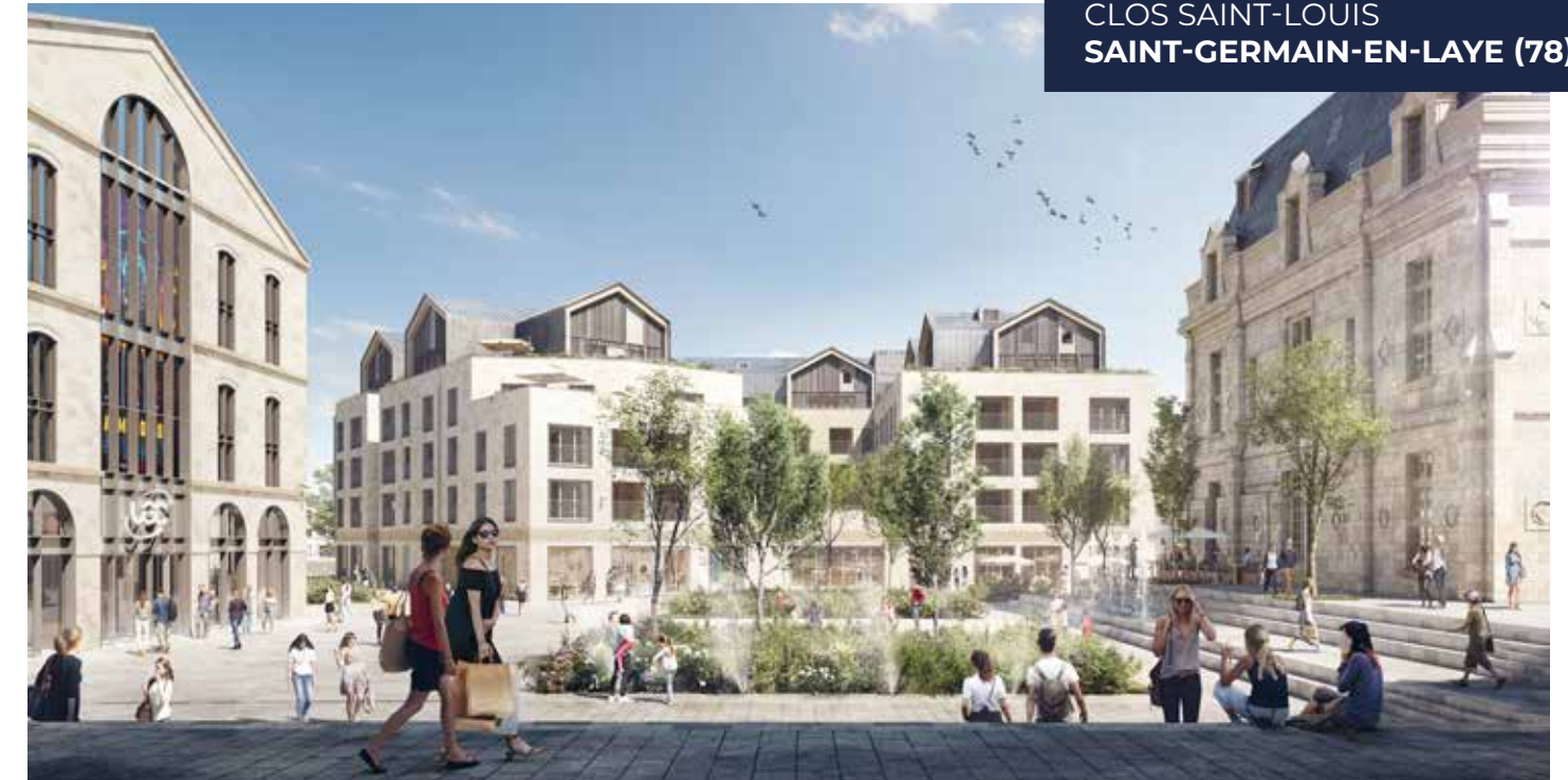
NOS EXEMPLES DE RÉALISATIONS DANS LA RÉGION