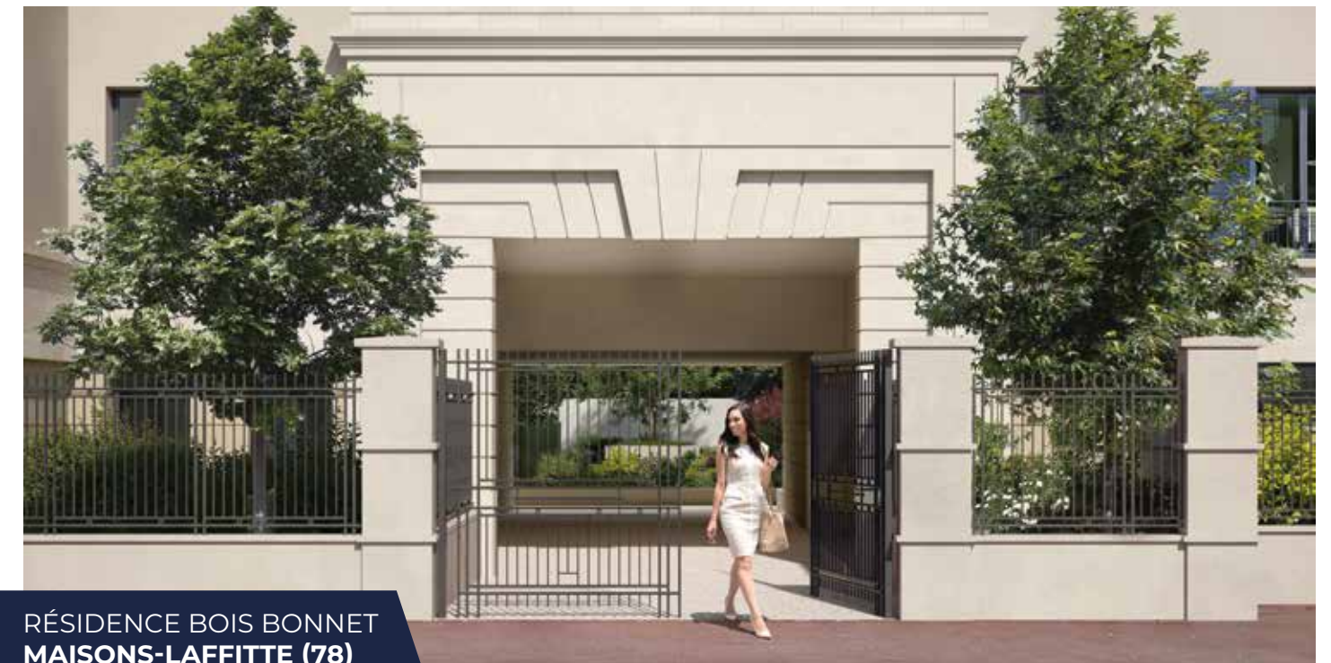
RÉSIDENCE BOIS BONNET MAISONS-LAFFITTE (78)