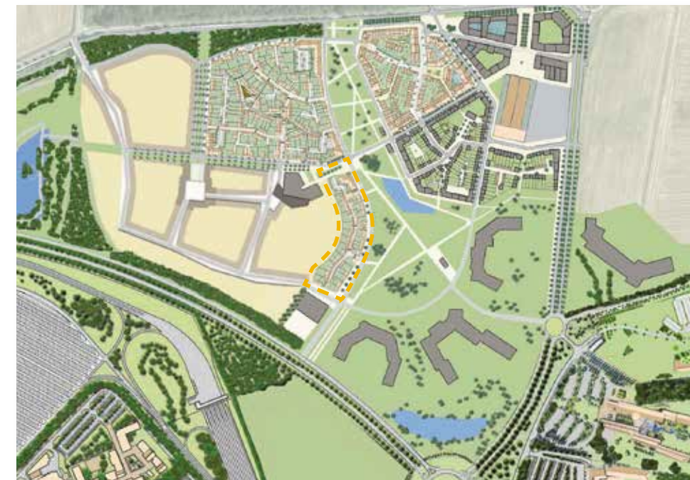
ZAC des Trois Ormes - les abords de lots sont donnés à titre indicatif