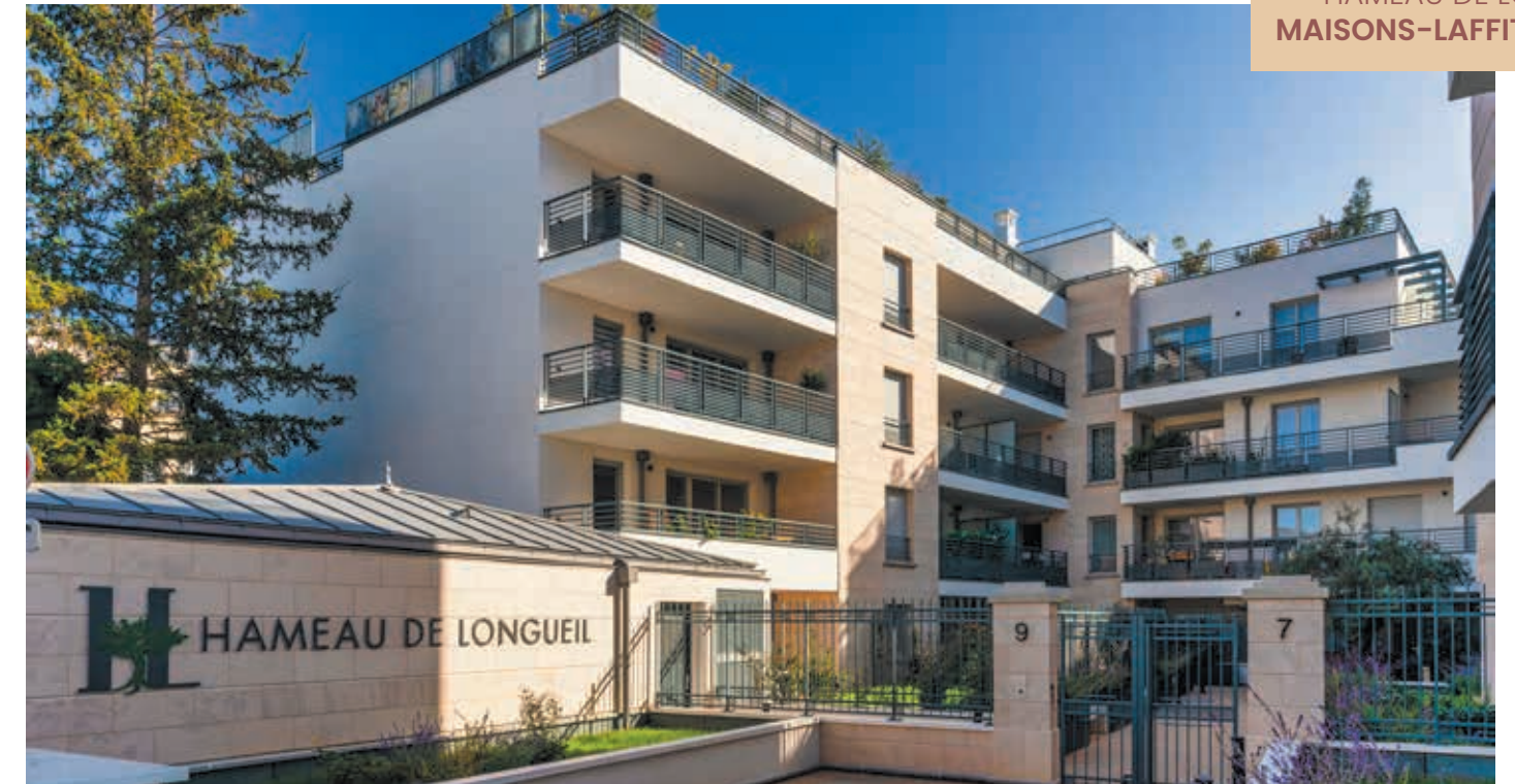
HAMEAU DE LONGUEIL MAISONS-LAFFITTE (78)