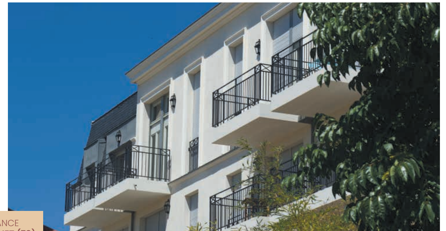
FRAGRANCE LE VÉSINET (78)