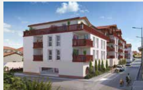
OCEYA À CAPBRETON (40)