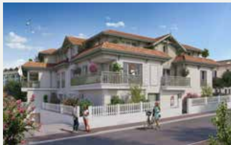
LES VOILES DU BASSIN À ARCACHON (40)