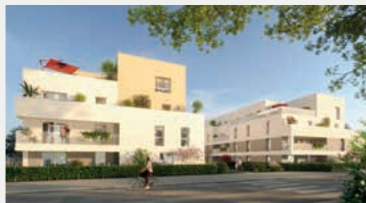
MILLESSENS À LA CHAPELLE-DES-FOUGERETZ (35)