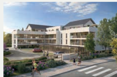
LE CARROUSEL À GÉVEZÉ (35)