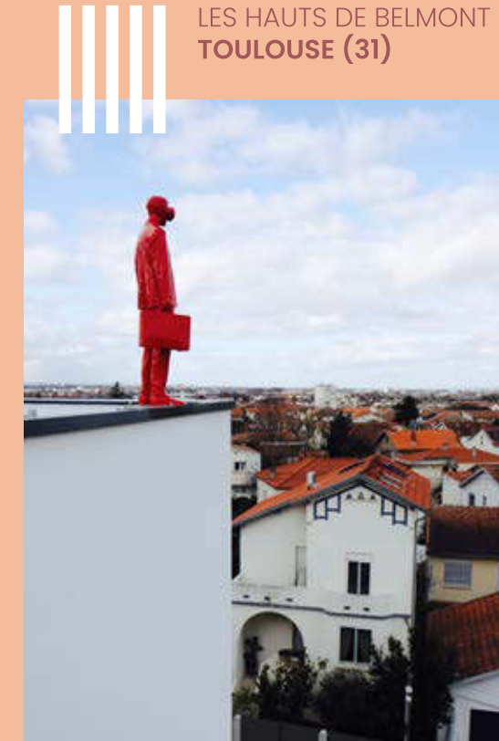
LES HAUTS DE BELMONT TOULOUSE (31)

NOS EXEMPLES DE RÉALISATIONS DANS VOTRE RÉGION