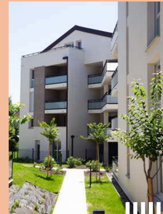
CARRÉ D'ORM TOULOUSE (31)