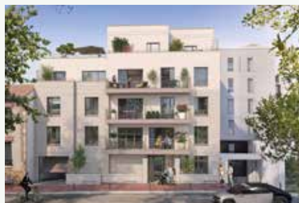
ALBA À VANVES (92)