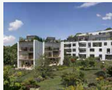
LES IMPRESSIONNISTES À VILLE-D'AVRAY (92)