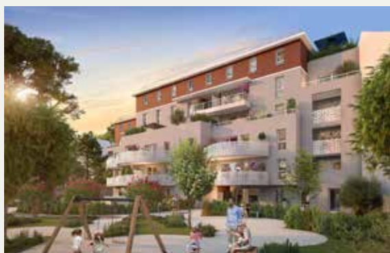
SANHA À LA SEYNE-SUR-MER (83)