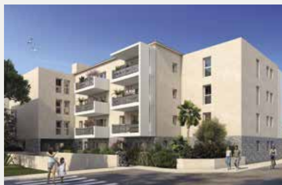
LE PATIO DES LYS AU MUY (83)