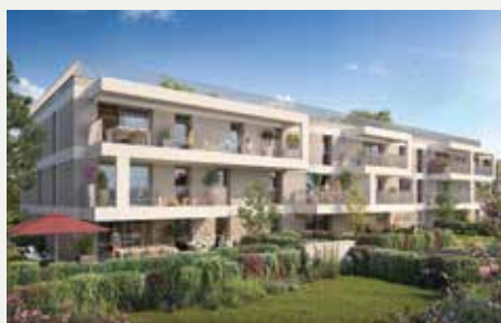
SILLAGE À LARMOR-PLAGE (56)