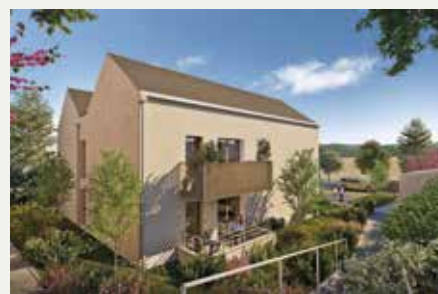
CARMEN À PONTIVY (56)