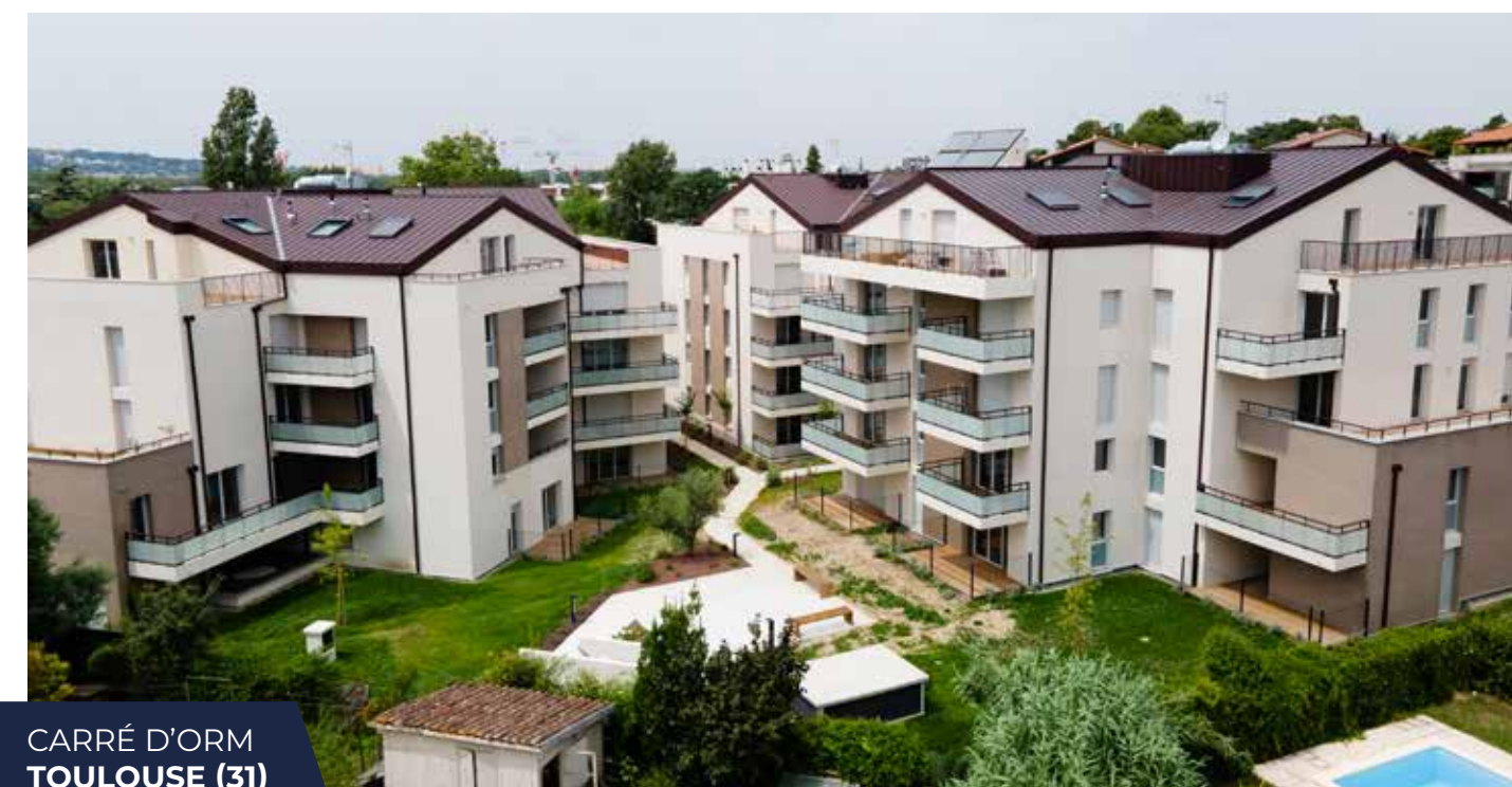
CARRÉ D'ORM TOULOUSE (31)