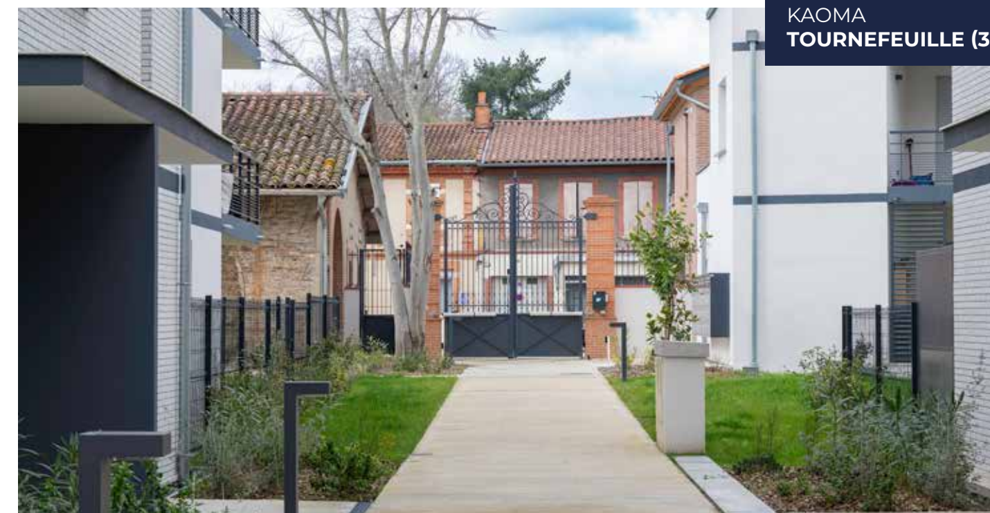
KAOMA TOURNEFEUILLE (31)