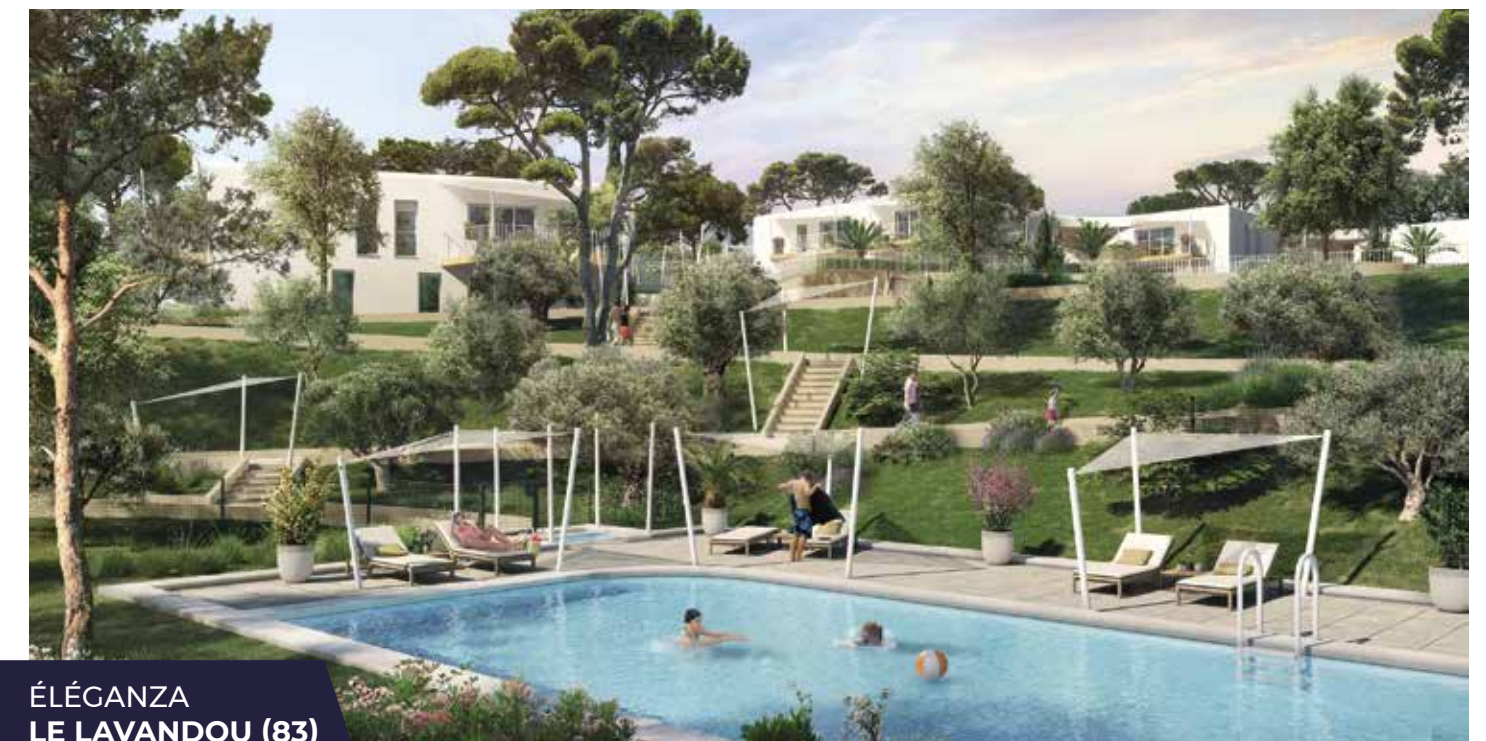
ÉLÉGANZA LE LAVANDOU (83)