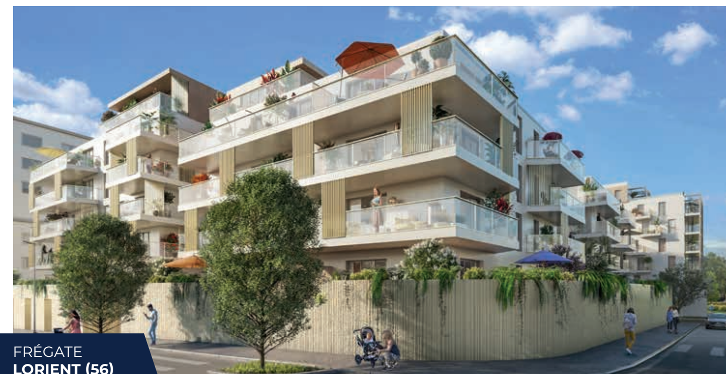
FRÉGATE LORIENT (56)