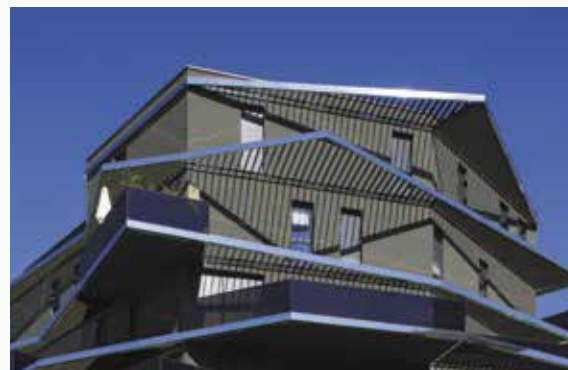
ORIGAMI À STRASBOURG (67)