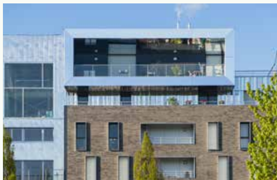
NOVA À STRASBOURG (67)