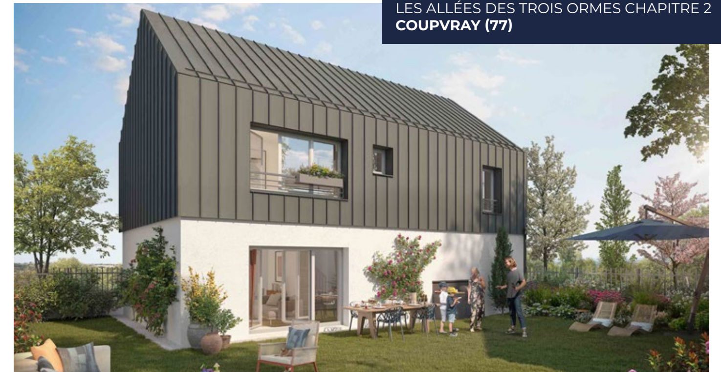
LES ALLÉES DES TROIS ORMES CHAPITRE 2 COUPVRAY (77)