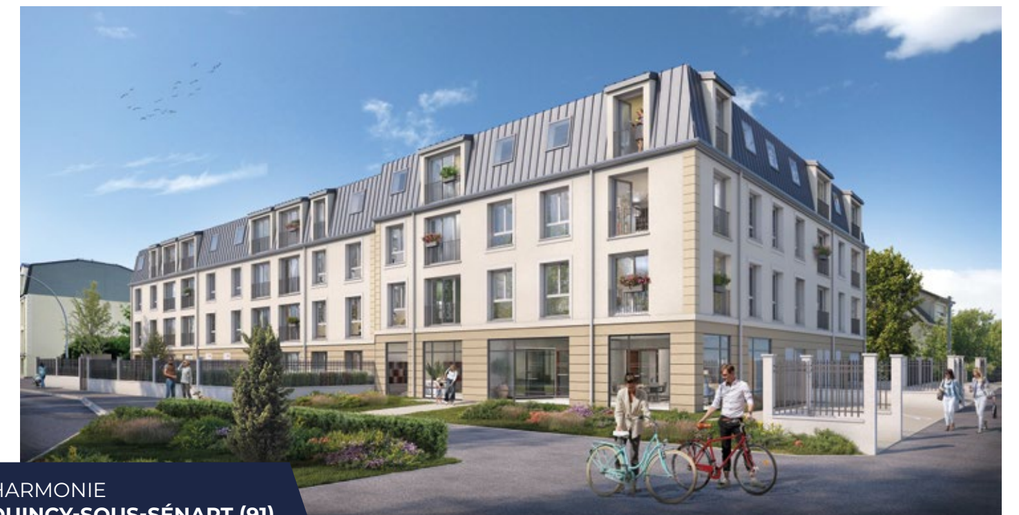
HARMONIE QUINCY-SOUS-SÉNART (91)