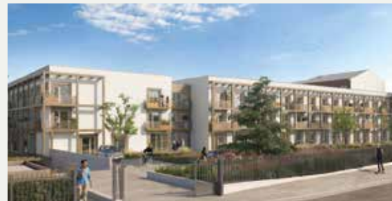
URBANÉO VENISE VERTE À NIORT (79)