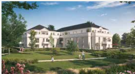
LA SAINT-CYRIENNE À SAINT-CYR-SUR-LOIRE (37)