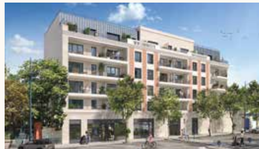
DUO VERDE À CHAMPIGNY-SUR-MARNE (94)