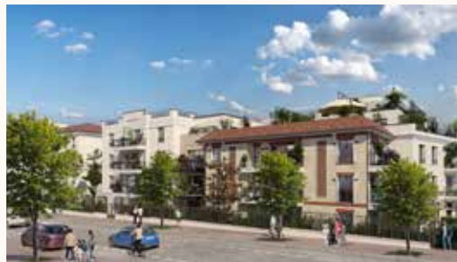
AVENUE CAVAINAC À SAINT-MAUR-DES-FOSSÉS (94)

NOS EXEMPLES DE RÉALISATIONS DANS LA RÉGION