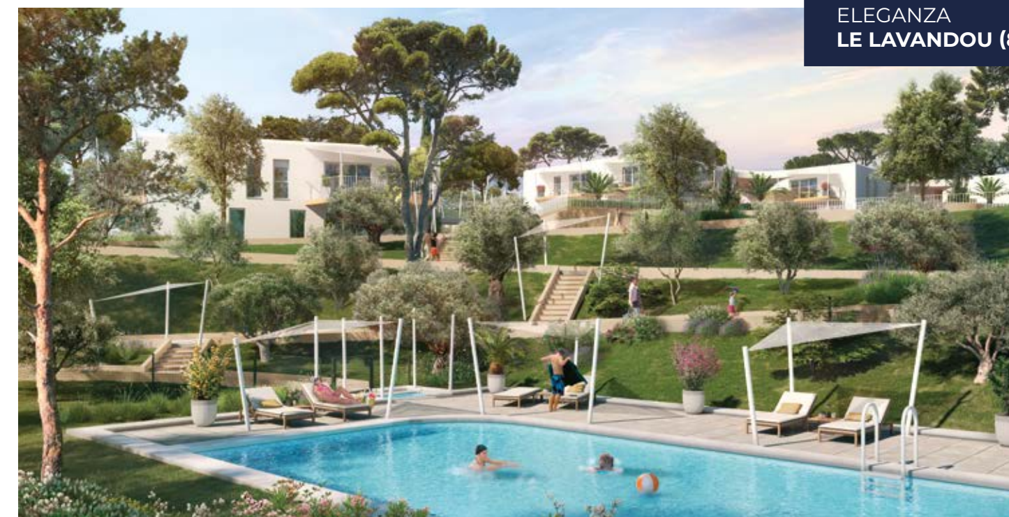
ELEGANZA LE LAVANDOU (83)