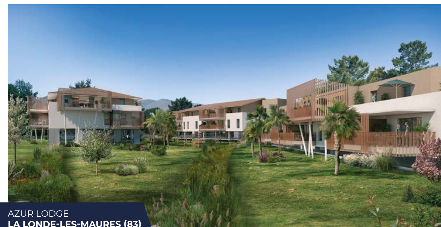
AZUR LODGE LA LONDE-LES-MAURES (83)