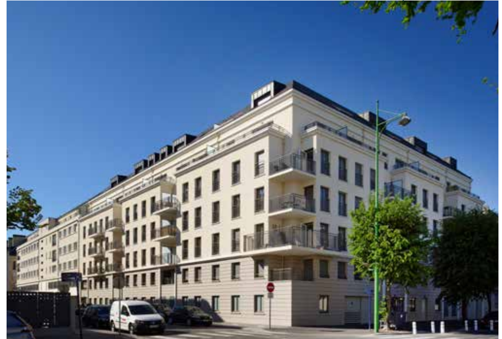
21 rue de la Miséricorde et 11 rue des Carmes - 14000 Caen

« L'eau et l'air » est un clin d'œil au bassin de plaisance qui se trouve à proximité de la résidence réalisée par Marignan. » Patrick Forfait