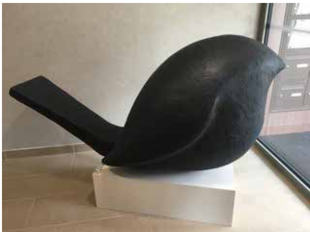
Chantal Blanchy Oiseau , 2017

Technique : Résine Dimensions : 80 x 160 x 75 cm