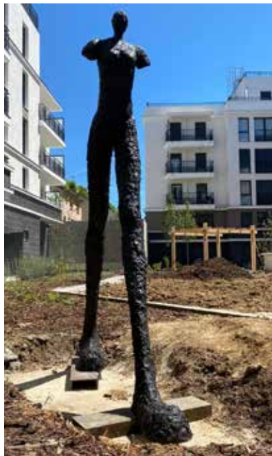
Nathalie Decoster Traces du temps , 2020

Technique : sculpture de 2.60 m en bronze.