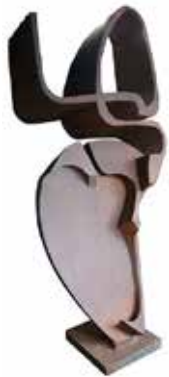
Cyrille Husson No te mires , 2019