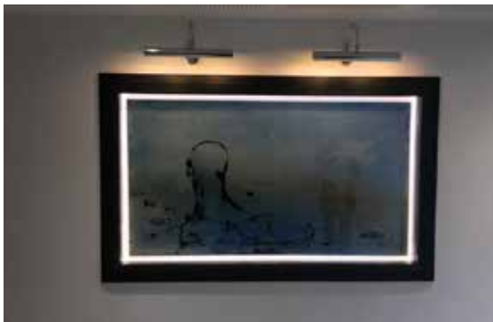
Agnès Pezeu, Entre ciels , 2019

« Mon travail met toujours en relation l'humain et la nature. Ici, l'homme scrute ce paysage où la mer côtoie l'infini. » Agnès Pezeu