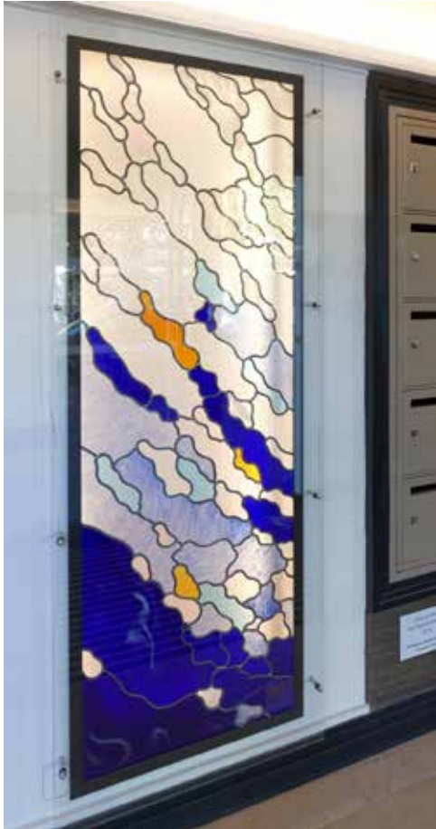
Patrick Forfait, L'eau et l'air , 2018

Technique : Vitrail : verre soufflé à la bouche. Sertissage : étain et plomb. Dimensions : 60cm de large sur 2 m de haut.